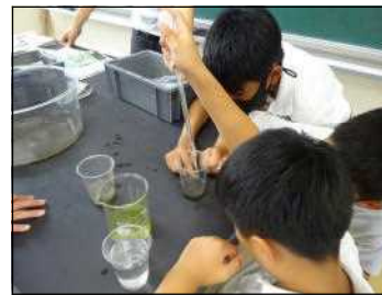
水中の生物を探す6年生