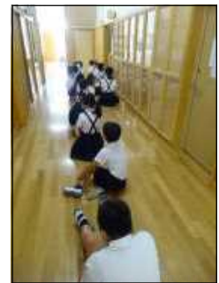
健診を待つ子どもたち