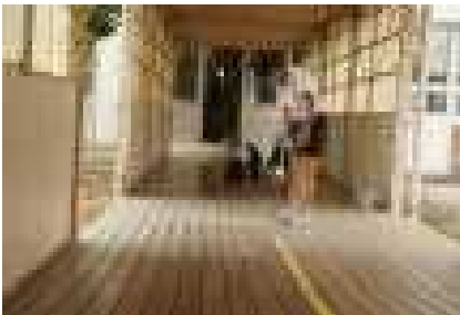
【友達と頑張る子ども達】